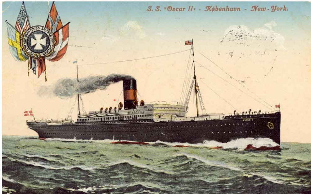
DFDS 's Oscar I

G.S.F. Medlemsservice, Skøringen Vest 19, 4660 Store Heddinge.